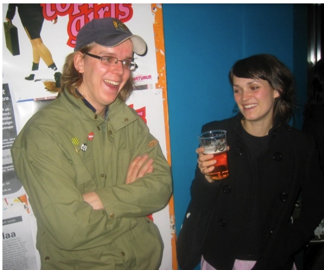
Til og med RF'ere koser seg på ASF-arrangement.